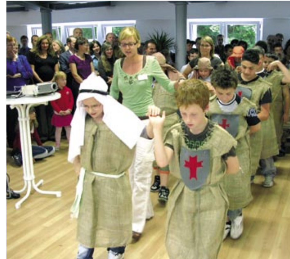
Am 10. Juli 2009 wurde die neue Enzbergerschule eingeweiht. Eltern und Angehörige der Kinder sowie eine große Zahl geladener Gäste konnten sich ein Bild der neuen Räumlichkeiten machen und erfreuten sich an den Darbietungen der Schülerinnen und Schüler

Das vorweg: Alle Schüler der Schule Enzberg haben Talente, sind liebenswert und machen Ihren Eltern, Lehrern und Sozialpädagogen Freude. Erschrocken sind deshalb die Organisatoren, Planer und künftigen Mitarbeiter der Schule Enzberg, als im Juli 2007 eine Zeitung „Schule für aggressive Kinder in Enzberg“ titelte. Wie konnte das passieren, dass der Journalist als Hauptmerkmal der geplanten Schule ausgerechnet eine „Aggressivität“ der künftigen Schüler nannte?