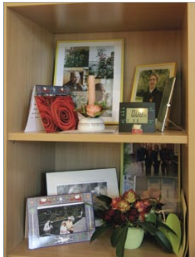
Wer aus seinem Bett aufblickt, sieht Vertrautes: Bilder und liebgewordene Gegenstände, von Mitarbeiterinnen und Mitarbeitern arrangiert, die die jeweiligen Bewohner oft schon lange kennen.

Der Badische Landesverein lässt diese neu entwickelte Wohnform von der Universität Heidelberg wissenschaftlich begleiten und auswerten. Obwohl der Landesverein für den Umbau der ehemaligen Tagespflegeräumlichkeiten in diesen Wohnbereich eine sechsstellige Summe aufgewendet hat, wird derselbe Kostensatz für die Bewohner berechnet, wie im übrigen Altenhilfezentrum.